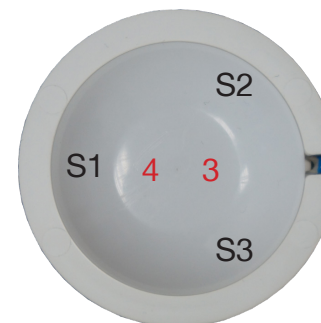
SCN-P360E3.03 Rückansicht - Back view